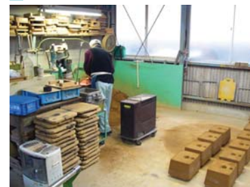
砂型 casting (試作)