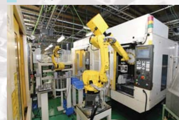
機械加工・アッセンブリ